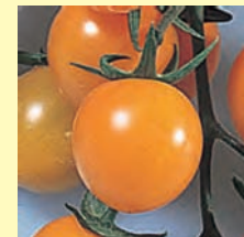
カロテンたっぷり