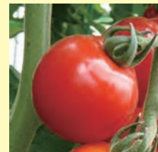
リコピンたっぷり