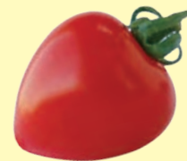
かにくがあつくてあまい