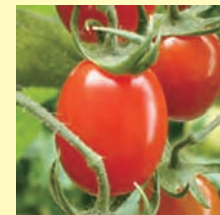
アミノさんたっぷり